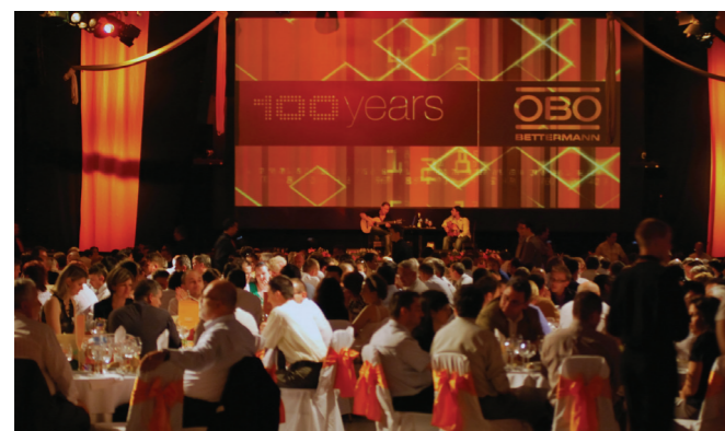
A 2010-ben elkészült és OBO-s színekbe öltöztetett gyártócsarnok fogadta az 500 meghívott vendéget.

Az OBO Bettermann cégcsoport május végén, Bugyin ünnepelte alapításának és fennállásának 100. évfordulóját. A rendezvény méltó volt az alkalomhoz: a vendégek felejthetetlen élménnyel gazdagodtak a sokszínű programnak köszönhetően. Az OBO Bettermann cégcsoport május végén, Bugyin ünnepelte alapításának és fennállásának 100. évfordulóját. A rendezvény méltó volt az alkalomhoz: a vendégek felejthetetlen élménnyel gazdagodtak a sokszínű programnak köszönhetően.