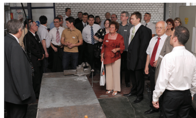
Gyárlátogatás és a STROKES produkciója: kellemes és hasznos programpárosítás

A rendezvényen a sajtó képviselői is jelen voltak: a Magyar Televízió riportere, a Népszabadság és a Budapester Zeitung újságírója beszámolt a nagyszabású ünnepségről, valamint a prominens személyiségek látogatásáról: Bettermann úr és Genscher úr az esemény előtt személyesen találkozott Orbán Viktor miniszterelnökkel, hogy a további beruházásokról és a jövőről tárgyaljanak.