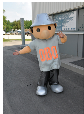
A bejáratnál az OBO-emberke köszöntötte és szórakoztatta az érkezőket.

A sikertörténi 100 évvel ezelőtt Németországban kezdődött, ahol az alapító, Franz Bettermann két szakmunkással 1911-ben nyitotta meg fémtömegcikk-gyártó üzemét Menden-ben. Ekkor még